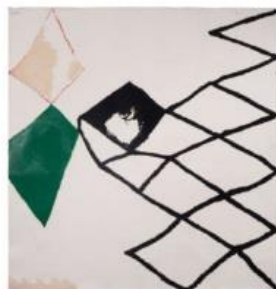
EN FUNCIO D'UN DIR Pintures i dibuixos (1994-2020) 3.10.2021—30.01.2022 Cal Puigjaner, Olesa de Montserrat (Obert discapacitats i diuenenges)